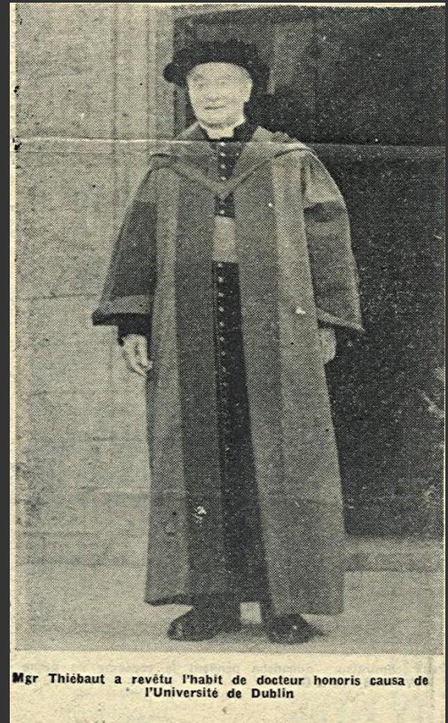
Mgr Thiébaud a revêtu l'habit de docteur honoris causa de l'Université de Dublin